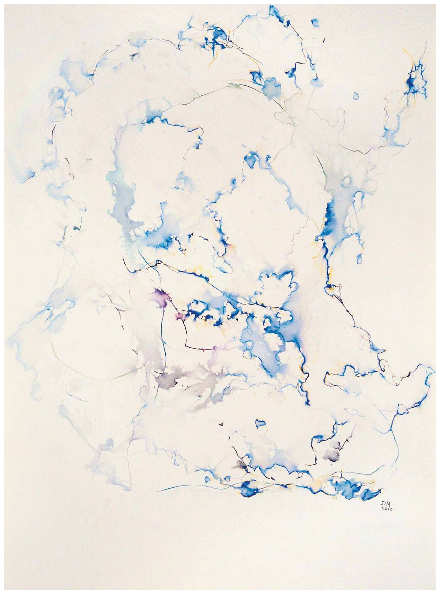
Daisy Mrázková, Thin line, 2010, rozmývaná kresba na papíře, 90 x 60 cm