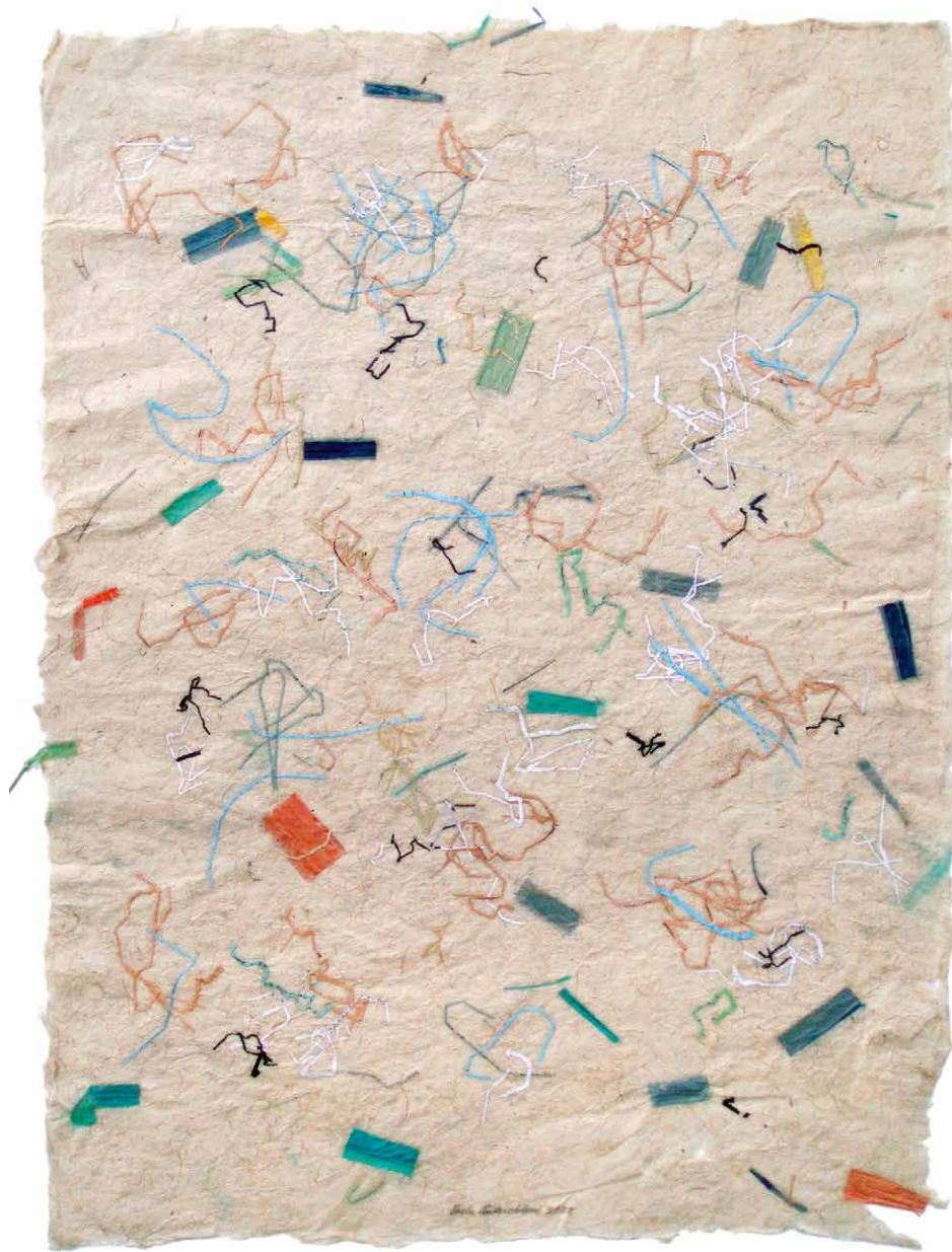
Pavla Aubrechtová, Bez názvu, 2002, koláž a skartace na papíře, 100 x 70 cm